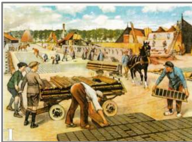
Steenplaats volgens schoolplaat Cornelis Jetses

Na afkoeling van de oven kunnen de stenen uitgereden en gesorteerd worden.