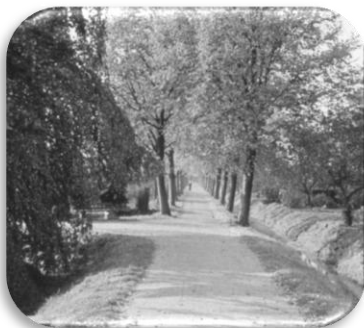
Korte Laning met oorspronkelijk Dievenpadje