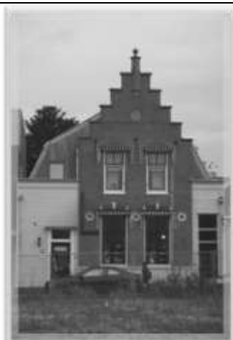
Kerkstraat 15 , foto links situatie 1973 en de foto rechts huidige situatie.