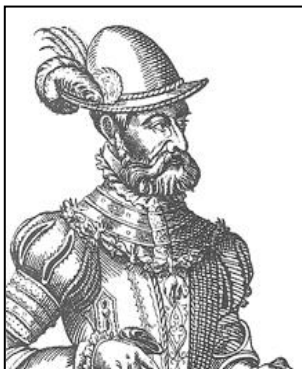
Lamoraal van Egmond

Lamoraal van Egmond werd naar de koning afgevaardigd om tot overeenstemming te komen inzake een godsdienstvrede. Zoals we