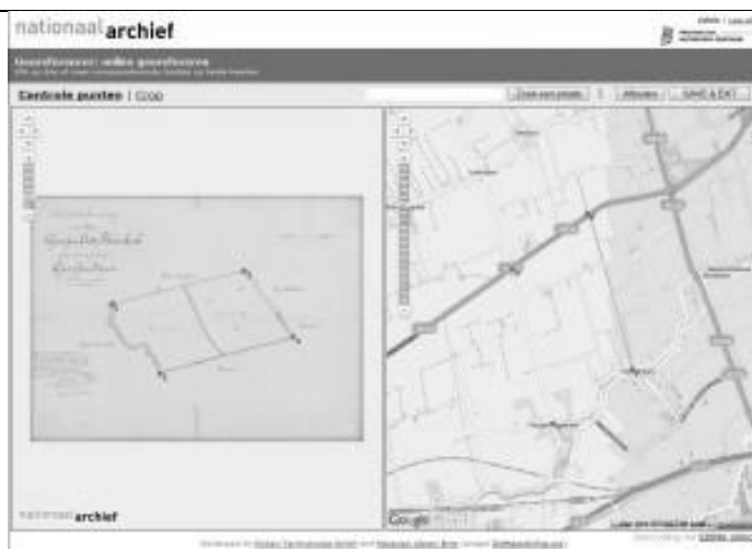
Screenshot bewerkingspagina Georeferencer Polder Giessen Oude Bovenkerk, gemeente Giessendam

Na het opslaan van een nieuwe bewerking, of wanneer op de pilot homepage is gekozen voor een al gegeoreferende kaart, wordt de resultaatpagina getoond. Op deze pagina kan snel worden bekeken of de kaart op de juiste plek is terechtgekomen. De Google Earth-plugin die hiervoor wordt gebruikt is een uitgeklede versie van de Google Earth-applicatie, maar biedt genoeg functionaliteit om een snelle controle uit te voeren.