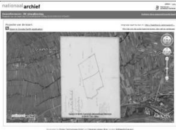
Screenshot resultaatpagina Georeferencer