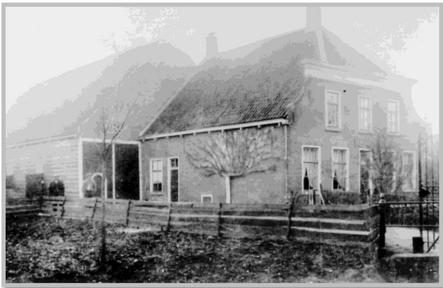
De boerderij van “van der Linden”, deze is nu afgebroken en heeft plaats gemaakt voor de Lindenhoeve